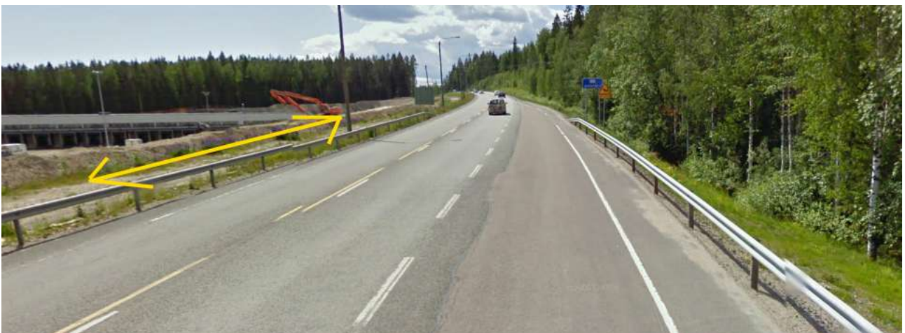
Kuva Pieleslehdon suunnasta Laukaantielle kaupunkiin päin. Kevytväylä on tulossa keltaisella merkitylle linjaukselle. Kuvassa ollaan noin mäen puolivälissä. Kuvapohja: Google Street View.