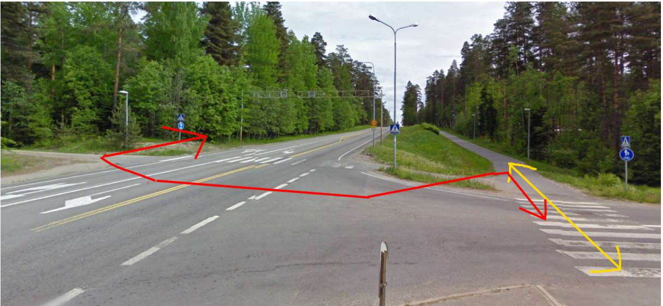
Laukaantien ja Kangasvuorentien risteys. Nykyinen kevytväylä on merkitty keltaisella. Alustavan tiesuunnitelman mukaan kevytväylä koukkaisi jatkossa punaisella merkittyä reittiä Laukaantien ali tien toiselle puolelle – ja pidemmällä takaisin toisen alikulun kautta. Tällaista pyöräilyn helppoutta ja sujuvuutta vähentävää ratkaisua ei voi mitenkään sallia. Kevytväylällä on jo nykyisin profiililtaan liian tiukka ja viereistä autotietä jyrkempi mäki, joten alikulku heikentäisi pyöräilyolosuhteita entisestään.